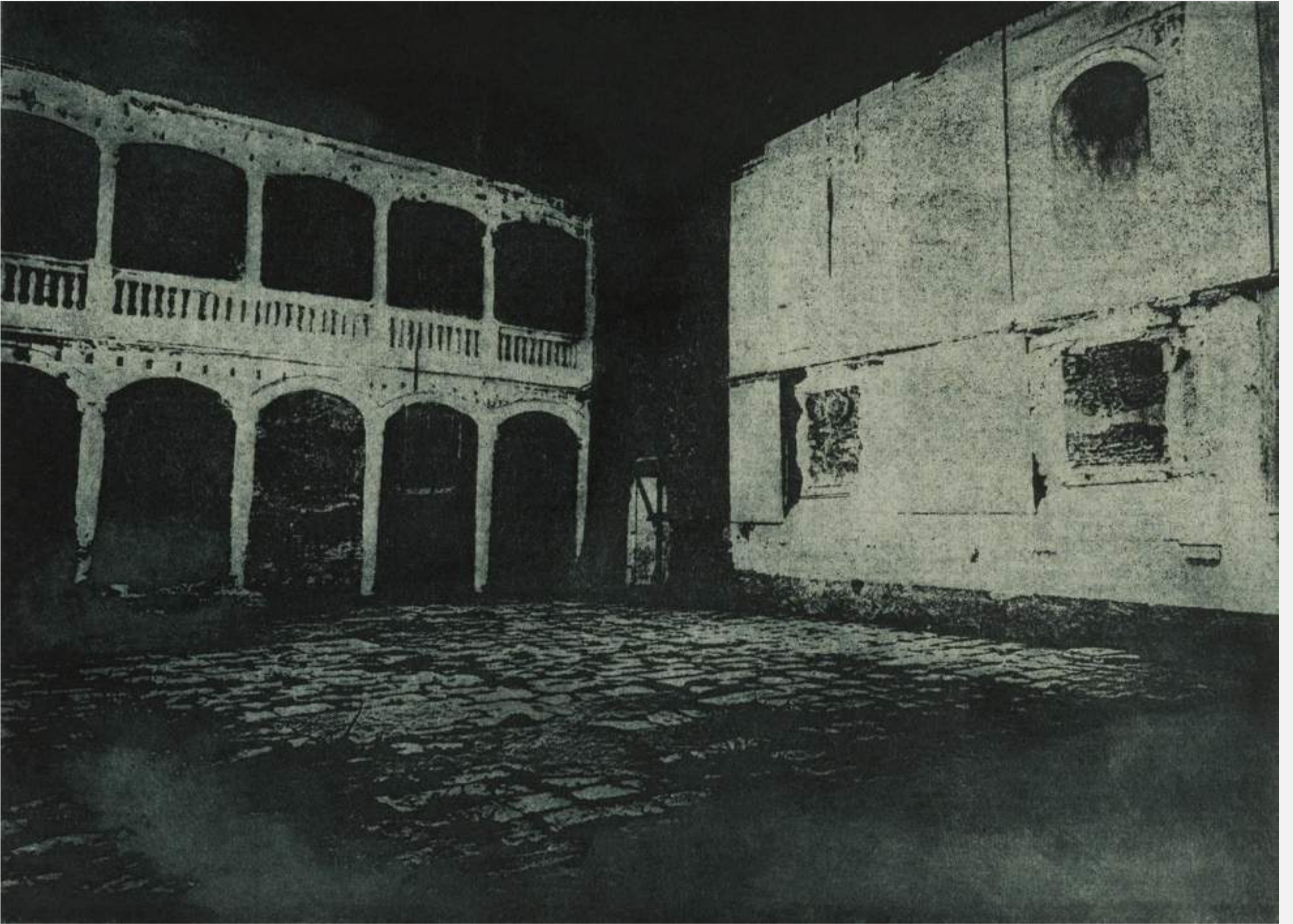
Soledad Sevilla En ruinas IV (nocturno 2) 1994