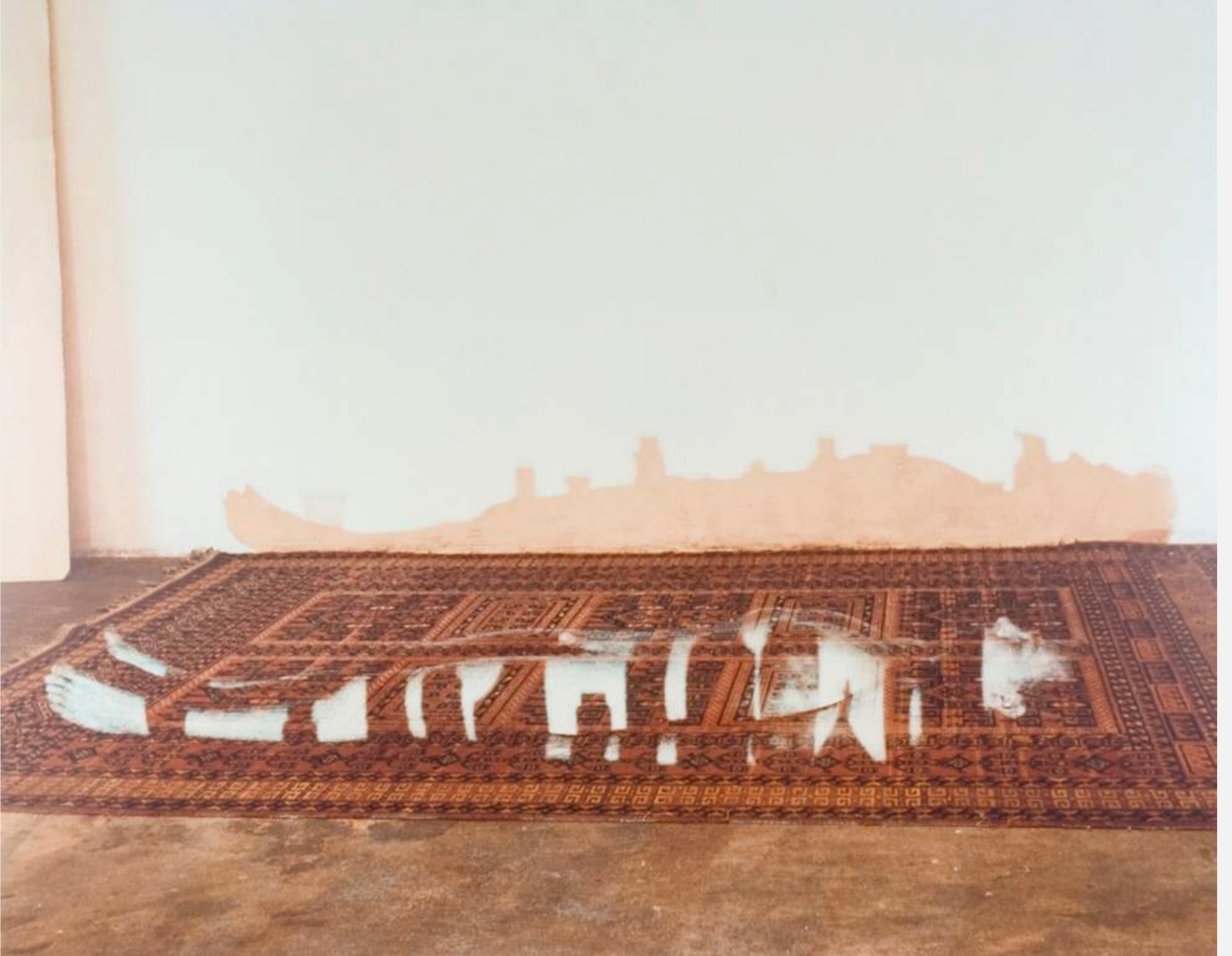
Eulàlia Valldosera El yacente: sombras llenas, I 1993