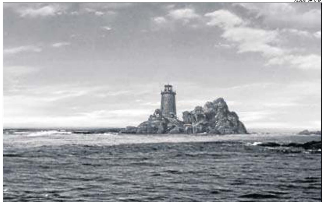
Un fotograma del vídeo 'Movies_1', d'Albert Bayona, seleccionat per exhibir-se en el certamen.