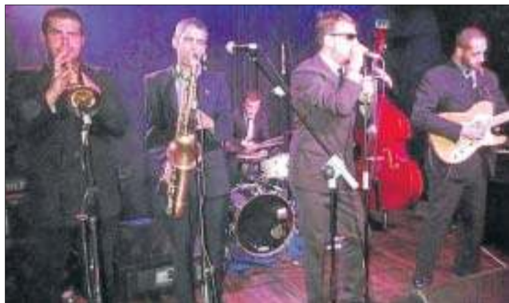
El grup barceloní Soweto, divendres al Cafè del Teatre.