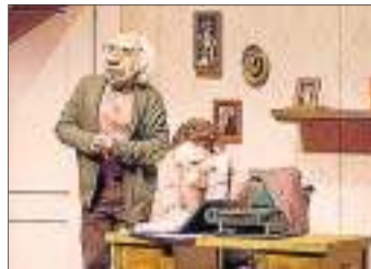
'André y Dorine', de Kulunka.