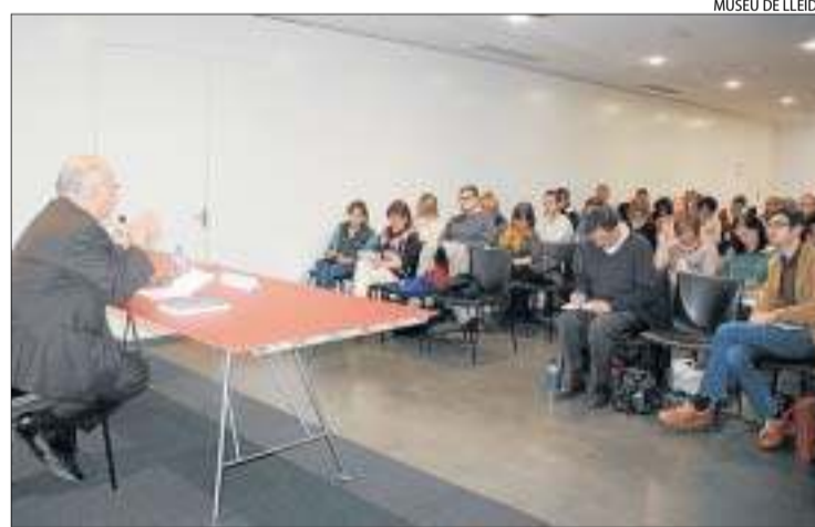
Una de las conferencias celebradas el viernes en el Museu de Lleida.