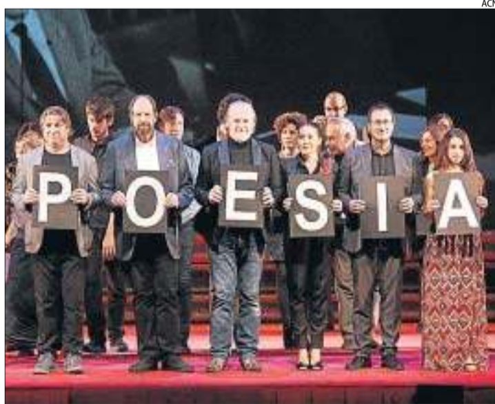
Varios de los participantes en el homenaje en Barcelona.